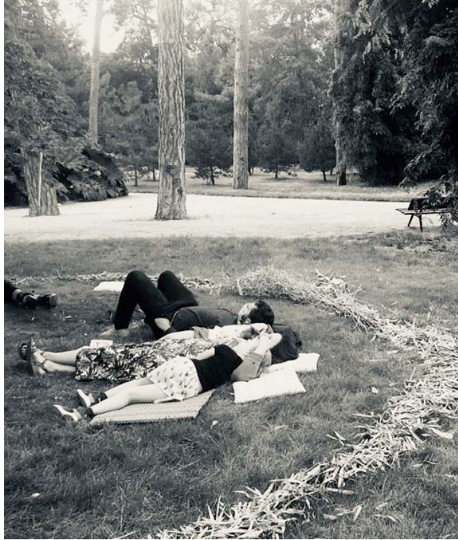
Parc Floral, 6 septembre 2020 – Un été particulier.