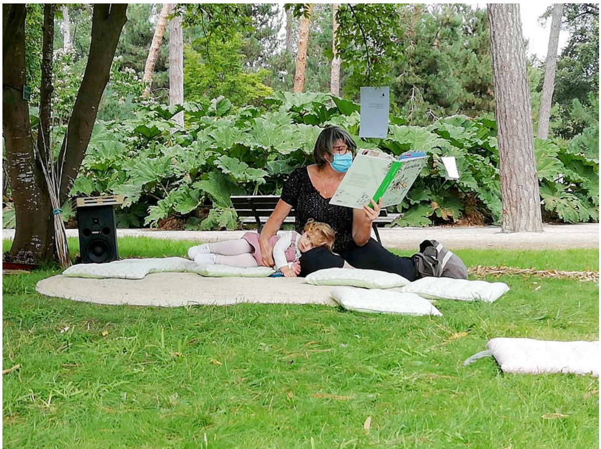
Parc Floral, 6 septembre 2020 – Un été particulier.

Le premier épisode de cette installation se présente sous la forme d'une pièce sonore, à partir du livre pour enfants de Gilles Clément et Vincent Gravé : Un jardin pour demain . Un livre qui met en scène le long voyage d'un jardinier pour constituer son "Jardin Planétaire" et qui rassemble ici, pour le tout public dès l'enfance, la pensée de l'écologiste Gilles Clément. Nourrie de sa philosophie, de son jardin en mouvement , cette pièce à écouter dans un espace dédié, tente d'épouser la dynamique du paysage sur lequel elle s'installe, d'entrer en résonance avec lui (que ce soit un jardin, une rue, une place publique, une cours d'école ou encore un lieu clos). Un espace niché dans le paysage avec différents endroits où s'installer, s'asseoir, s'allonger, écouter, regarder, sentir, être seul ou à plusieurs. Une pièce sonore à écouter en jouant, assis ou debout, en se balançant dans un hamac ou en déambulant sous casque... Cette installation pourra également être pensée en intérieur : alors, il s'agira de recréer un espace d'écoute, où la nature et les jardins suspendus auront leur place et entreront en résonance avec le texte de Un jardin pour demain .